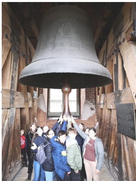
Serce jak Dzwon Zygmunta

„Wypaszczeni” pandemią coronawirusa uczniowie z całej Polski ruszyli zwiedzać ciekawe miejsca w naszym kraju. Nie jesteśmy w tym temacie inni, ciągnie nas do przynależności.