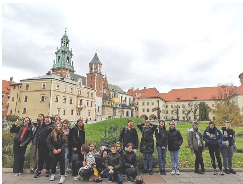
Na Wawelu czas się nie dłuży...